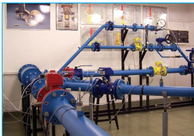
Fot. 2. Laboratorium pomiarów przepływu Photo 2. Fluid flow measurement laboratory

Zespoły Inżynierii Systemów Ciepłowniczych i Inżynierii Systemów Gazowniczych prowadzą działalność badawczą w dyscyplinach Inżynieria środowiska, górnictwo i energetyka oraz Inżynieria lądowa i transport, do których przyporządkowany jest kierunek studiów Inżynieria Środowiska. Studia prowadzone na tym kierunku w Politechnice Warszawskiej mają profil ogólnoakademicki, dlatego w programie studiów nowej specjalności uwzględniono udział studentów w zajęciach przygotowujących do prowadzenia działalności naukowej oraz przewidziano udział studentów w bieżącej działalności naukowej realizowanej w obu wyżej wymienionych zespołach. W wyniku konkursu Ministerstwa Nauki i Szkolnictwa Wyższego Politechnika Warszawska posiada status uczelni badawczej na lata 2020–2026. Jednym z priorytetowych obszarów badawczych, dzięki którym Politechnika chce stać się uczelnią badawczą mocniej rozpoznawalną na arenie międzynarodowej, jest konwersja i magazynowanie energii.