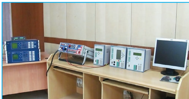
Fot. 3. Laboratorium systemów dyspozytorskich Photo 3. SCADA systems laboratory

W programie studiów położono również nacisk na aspekty praktyczne i rozwiązywanie praktycznych problemów projektowych stojących przed inżynierami. Absolwenci kierunku studiów Inżynieria Środowiska mogą ubiegać się o uprawnienia budowlane bez ograniczeń w specjalności instalacyjnej w zakresie sieci, instalacji i urządzeń cieplnych, wentylacyjnych, gazowych, wodociągowych i kanalizacyjnych. W programie studiów przewidziano także czterygodniową praktykę zawodową.